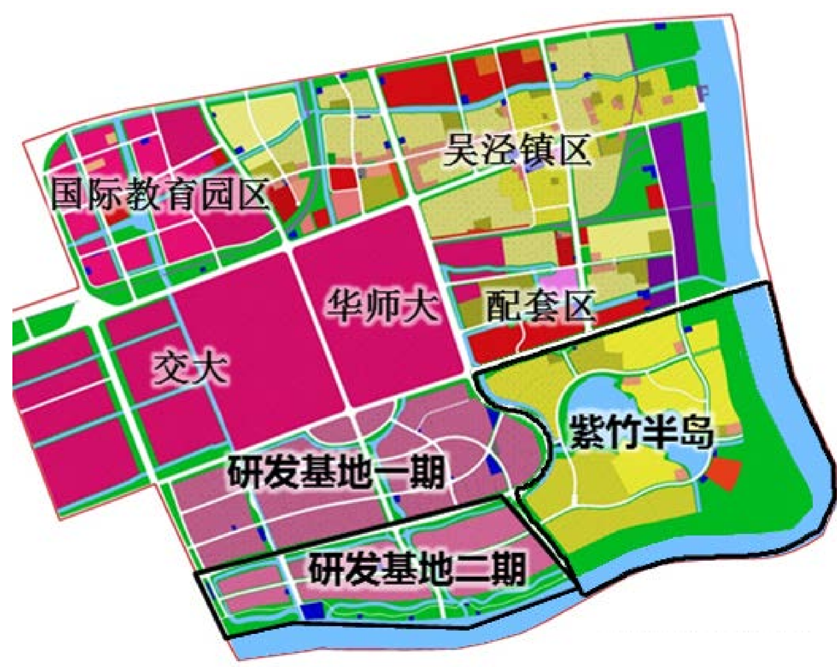
紫竹科学园区功能板块示意图