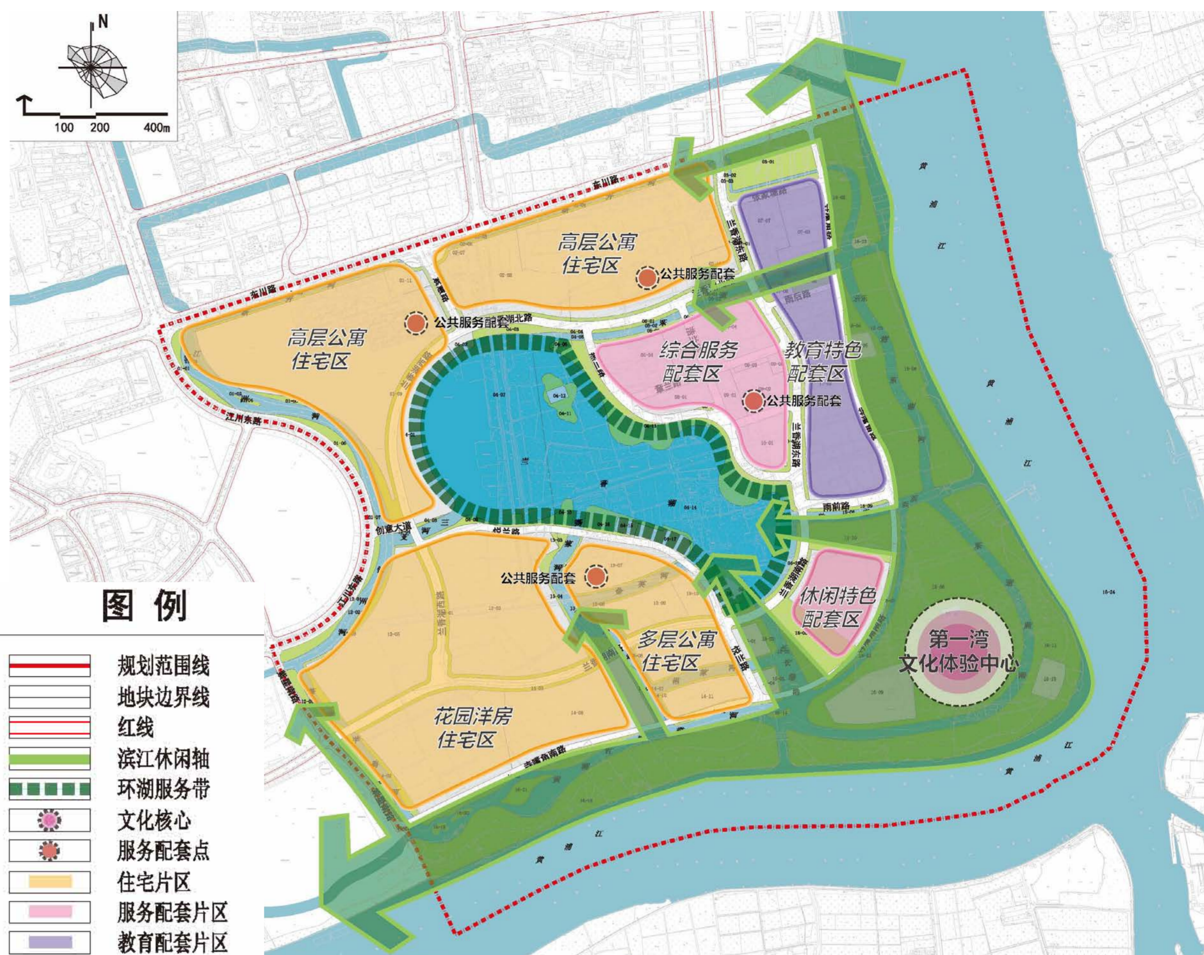
紫竹半岛规划结构分析图

七区共融： 高层公寓住宅区、花园洋房住宅区、多层公寓住宅区、综合服务配套区、休闲特色配套区、教育特色配套区等七个功能片区。